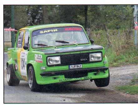
Mallet volait... avant que la boîte ne s'en mêle